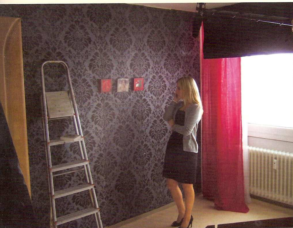
^ Drehort: Stefan-Zweig-Straße.